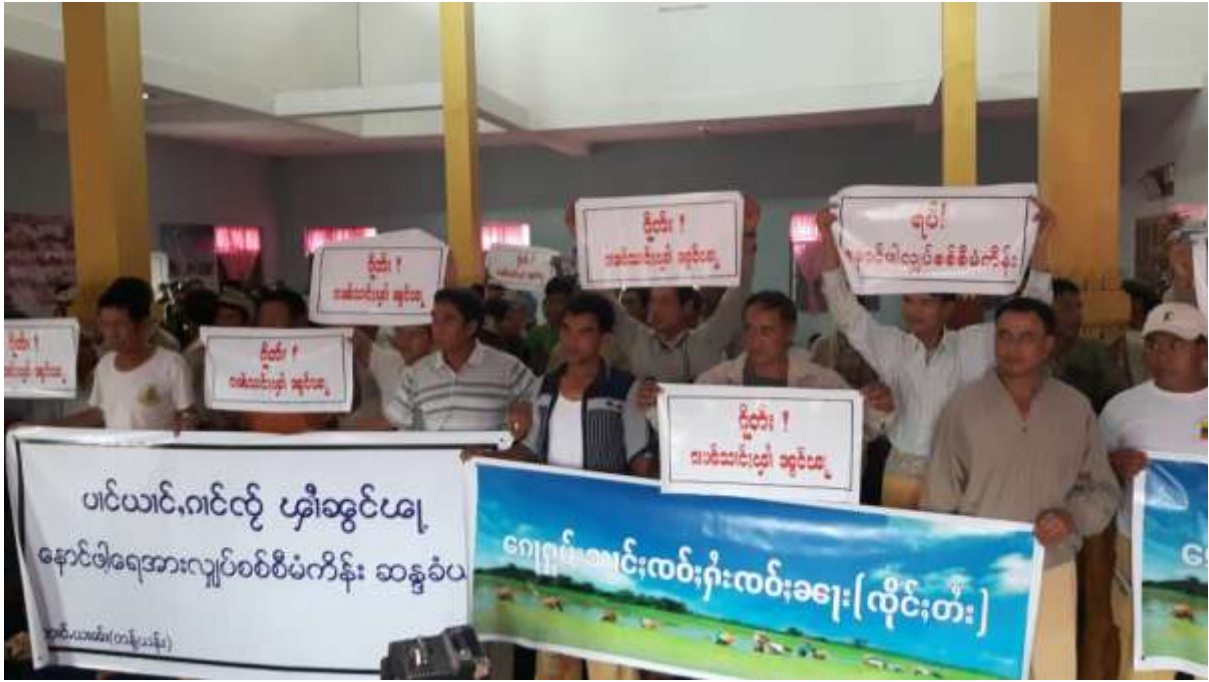
ရှုမ်းမိုင်း 250 ကဆင်လုဂ်းမးတီး၊ ဂပ်းဂူိုင်, ဆွဲးစလးဝီင်းတင်.ယာဆင်း စဆဂင်လုံသာဆဲးစတီးဖေဆွင်ယေ၊ မိုဝ်းဝဆင်းထီ 05-08-2016