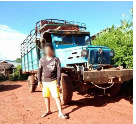
လမ်းထူင်းကခေလူးသိုက်မခင်းခါခင်းတေ,သူင်,ပခင်ခပ်

မိုင်းဝခင်းထိ 5/7/2020 ခေခိုင်သိုက်မခင်းမလရ 294 လွင်,လွံ တွခင်း မူးသေခပ်,ဂျူးခင်းတခင်း,လွင်လမ်း။ သိုက်မခင်းခါခင်း ထူင်းသီ,လမ်း-ထူင်း, လုင်းခခေင်,တါ ထူင်းလုင်းဂိပ်, ထူင်းလုင်းဂုင်,တလ ခေေးထူင်း, လုင်းမိုင်း လှိုင်ခေ်ဂျူးတေ,တိုင်,ခပ်; ခေမိုတင်းဂါခင်ခပ် တီးရှမ်းငါးသေ ကပ် ခိုခင်း သူင်,ပခင်ခပ်ရှိုင်ထိုင်ခိုင်လွံတွခင်း။ မိုင်းဝခင်းထိ 5/8/2020 ခေခိုင် ဂေေး သိုက် မခင်းမလရ 575 ခါခင်းထူင်းဂူခင်း တခင်း,လွင်လမ်း သွင်လမ်း။ ထူင်း လုင်းသိုင်,ခမ်းခေေးထူင်းလုင်းမွင်,၊ လံး,ဂျူးတိုင်,ကပ်သိုက်မခင်း တီးခပ် တီးရှမ်းငါးထိုင်လွံပိတ်,။ သိုက်မခင်းပခင် ဂူးခေမိုမခင်းခိုင်လမ်း 20,000 ဂျပ်။