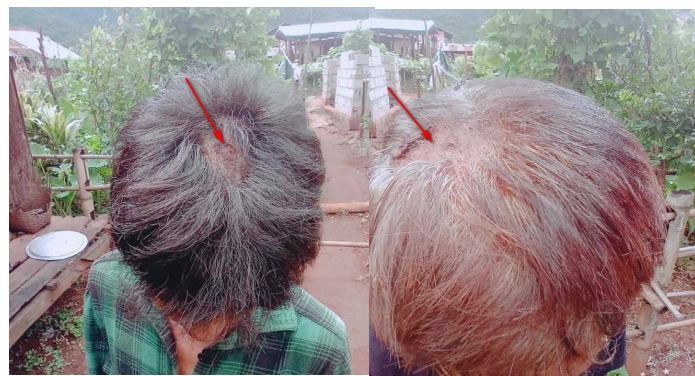
ဂုဏ်းဝခင်းလူင်လခမ် ကခင်းဂျးသိုက်းမာခင်းပေ့ထုပုံ.တီးဂျှပ်

ဗွင်းဂျးပေ့ထုပုံယု,ခခေ သိုက်းမာခင်းလိတ်းထခင်းဝပ်း “ပီခင်းသိုက်း RCSS လခင်းသူမးကပ်ခပ်,ရှင်ဂျး? လခင်းသူမး ဂေ့.ဂျးရှင်?” ခခေလိုင်းခခေ။