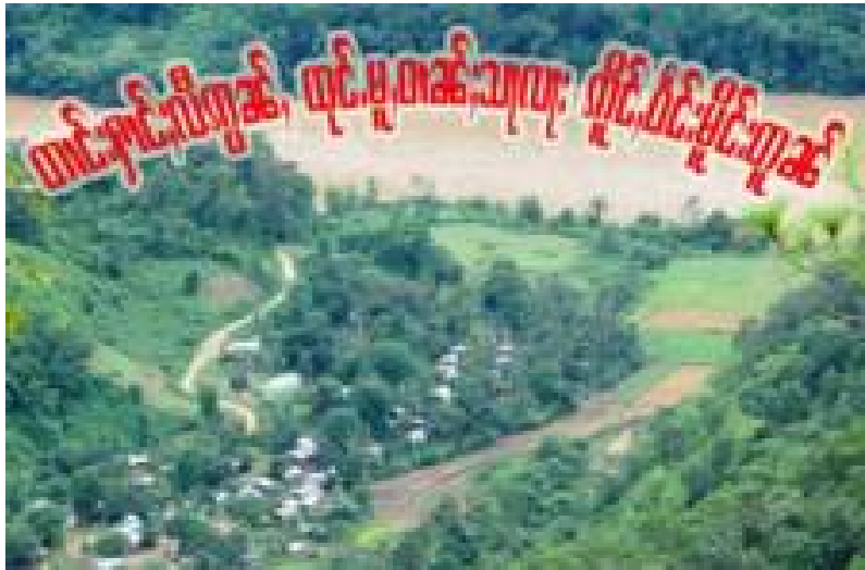
ပုံ - သံလွင်မြစ် အရှေ့ဘက်ရှိ မိုင်းတုံ မြို့နယ် ဝမ်ဆာလား ရွာ