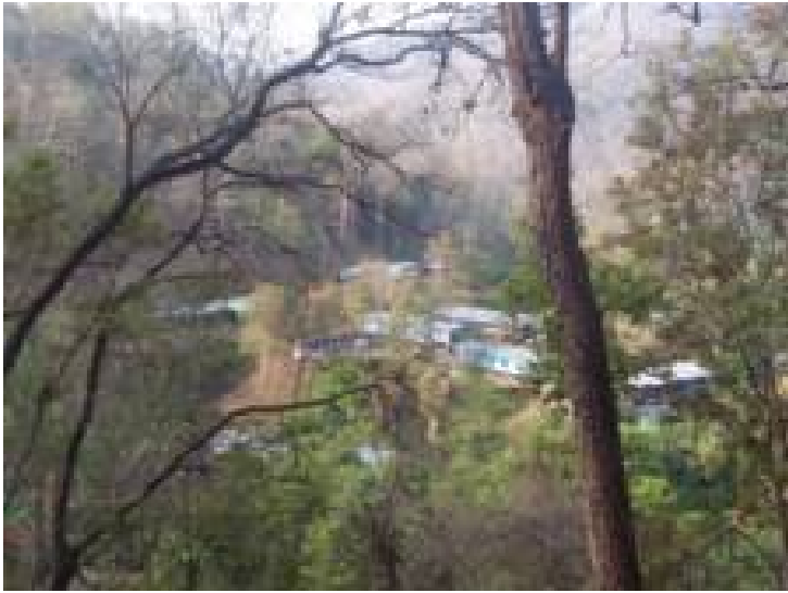
ပုံ - တရုတ် အင်ဂျင်နီယာများနေသည့် မယ်ပျို စခန်း

ကိုဖြတ်ပြီး ဝမ်ဆာလားရွာမှ (၁၂)မိုင်ခန့်ကွာဝေးသည့် မယ်ပျိုအလုပ်ခွင်ဆီသို့ မောင်းနှင်သွားခဲ့တာကို တွေ့ မြင်ခဲ့ပါတယ်။ တာချီလိတ်မှ SURF မော်တော်ကားဖြင့် လာခဲ့တာဖြစ်ပြီး ၎င်းတို့အနက် အချို့မော်တော်ကား များသည် မိုင်တုံရေကာတာစီမံကိန်းအတွက် ရင်းနှီး မြှုပ်နှံထားတဲ့ မြန်မာကုမ္ပဏီ IGOEC (International Group of Entrepreneurs Company) ပိုင်မော်တော်ကားများဖြစ်တယ်လို့ ဆိုပါတယ်။