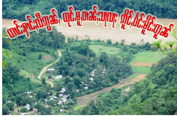
บ้านศาลา ตั้งอยู่ทางฝั่งตะวันออกของแม่น้ำศาลาวิน อำเภอเมืองไต่น

พื้นเมืองก่าง ซึ่งตั้งอยู่ที่แม่แกน ทางใต้ของเมืองไต่น โดย มีต้นวินเป็นผู้นำหน่วย จายเปตี้ แต่งงานกับนางเน็งและมี ลูกสาวด้วยกันหนึ่งคนชื่อนางคำซิ่น เขาทำธุรกิจทำไม้ ขนาดเล็ก และว่าจ้างชาวบ้านเป็นคนงาน ขณะถูกยิง เขา สวมชุดสีเขียวเข้มเหมือนทหารบ้าน (militia) ก่อนหน้านี้ เขาเคยเข้าป่าตัดไม้ แต่ตอนนั้นไม่ได้สวมชุดเครื่องแบบ แต่เริ่มมาสวมชุดเครื่องแบบหลังจากคณะวิศวกรชาวจีน เข้ามาในพื้นที่เมื่อเดือนกุมภาพันธ์ 2561 เพื่อสำรวจพื้นที่ สร้างเขื่อนเมืองไต่น จากข้อมูลของชาวบ้านคนอื่น ๆ หลังจากคณะชาวจีนเข้ามาในพื้นที่ มีการรักษาความ ปลอดภัยเข้มงวดมากขึ้น จายเปตี้ จึงสวมชุดทหารบ้าน(militia)ของกองทัพพม่าเพื่อความปลอดภัย