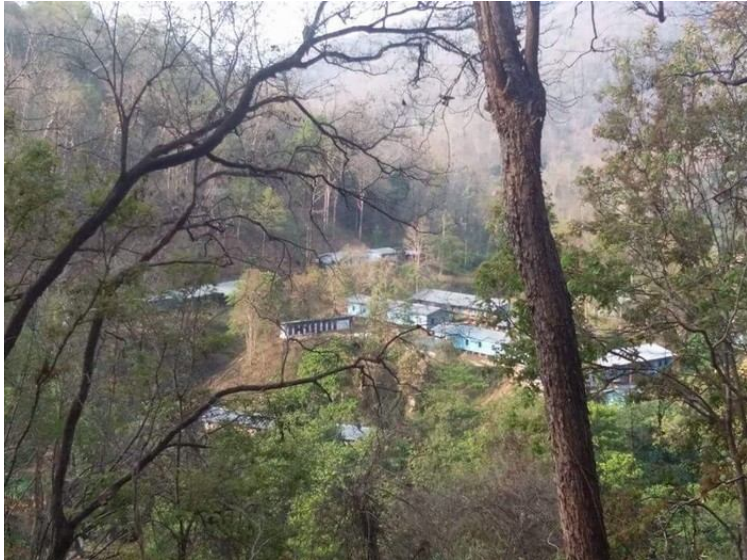
แคมป์งานแม่ปะ ที่คณะวิศวกรชาวจีนสำรวจเขื่อนเข้าพัก

ชาวบ้านบอกว่า มีการรักษาความปลอดภัยอย่างเข้มงวดให้กับคณะผู้สำรวจชาวจีน พวกเขาพักอยู่ที่ไซต์งาน และไม่ได้ลงมาที่หมู่บ้านศาลา โดยมีทหารพม่าจากกองพันทหารราบเบาที่ 580 (ภายใต้กองบัญชาการทหารที่ 14 ซึ่งมีฐานทัพอยู่ที่เมืองสาด) และกลุ่มทหารบ้าน (ซึ่งอยู่ใต้การกำกับดูแลของ กลุ่มอาสาสมัครในพื้นที่เมืองก่าง และกองทัพบกพิทักษ์ชายแดนที่ 1007) ให้การดูแล เวลาที่ออกไป