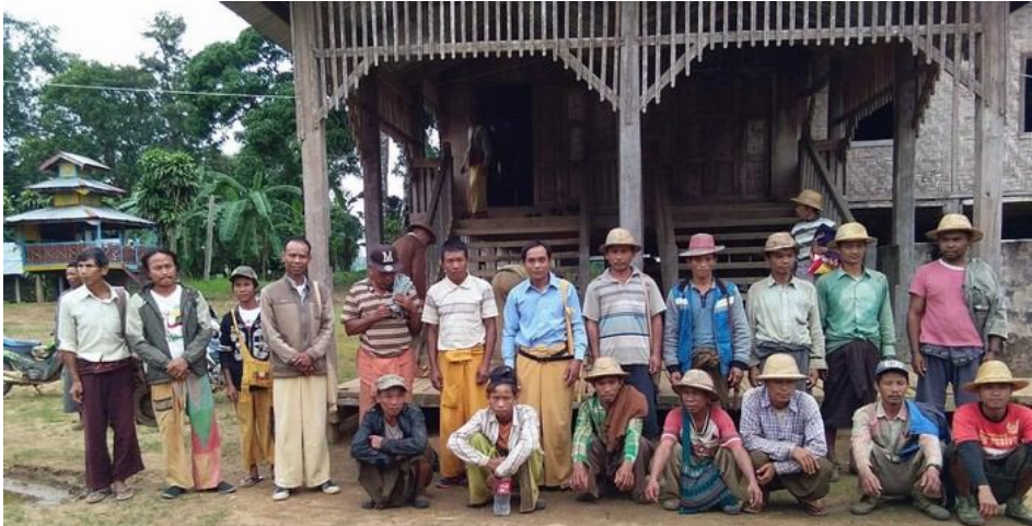
ဆင့်ခေါ်သွားခြင်းခံခဲ့ရသောဒေသခံရွာသားများနှင့်SNLD လွတ်တော်ကိုယ်စားလှယ် ပန်ကျန်ဘုန်းကြီးကျောင်း

ထို့နောက် ပိန်းနင်နှင့် အကြီးမှ ရွာသား ၁၅ ယောက်ကို နေရပ်အိမ်သို့ ပြန်လည်လွတ်ပေးရန် ခွင့်ပြု ခဲ့ကြောင်း။ သို့သော် ပန်ကျန်ရွာမှ ရွာသား ၂ ဦးကို ထိုနေ့တွင် ပြန်မလွတ်ပေးပဲ ၎င်းစစ်တပ်တို့ နှင့်အတူ ဩဂုတ် ၉ ရက် သူတို့ ၎င်းရွာမှ ထွက်ခွာသည်အထိ ဆက်၍ခေါ်ဆောင်ခဲ့သည်။