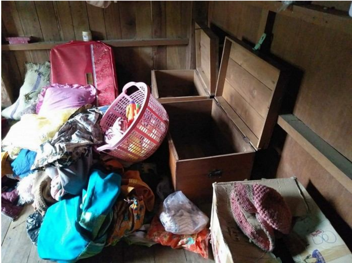
အစိုးရတပ်ခိုးယူလုယက်ခဲ့သော ဒေသခံရွာသားများ၏ပစ္စည်း

အရှေ့မြောက်ပိုင်းဒေသဆိုင်ရာစစ်ဌာနချုပ် (လားရှိုး) လက်အောက်ခံ နမ့်လန်အခြေစိုက် ခမရ ၅၀၅ နှင့် ခမရ ၅၀၆၊ နောင်ချိုအခြေစိုက် ခမရ ၅၀၄ တပ်ရင်း၃ရင်းမှ အစိုးရတပ်အင်အား ၆၀ ခန့်တို့သည် ဩဂုတ်လ ၉ ရက် ၂၀၁၈ ခုနှစ် ၁၀း၃၀ နာရီအချိန်တွင် ကျောက်မဲမြို့နယ် ပန်စံကျေးရွာအုပ်စု ပိန်းဆော့ ရွာကိုဝင်ခဲ့ပြီး ပါမန်၏နေအိမ်ကို အဓမ္မ ဝင်ခဲ့ကြောင်းသိရပါသည်။