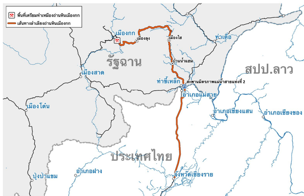
แผนที่ เส้นทางคาดว่าจะลำเลียงถ่านหินเมืองกก

ทั้งนี้ คาดว่าจะมีการส่งถ่านหินบางส่วนไปป้อนโรงไฟฟ้าถ่านหินขนาด 23 เมกะวัตต์ ซึ่งอยู่ระหว่างการก่อสร้างที่บ้านน้ำแสม ที่ตั้งอยู่ระหว่างเมืองโฮและท่าซี้เหล็ก เป็นโรงไฟฟ้าของบริษัทมินแคตติท (Minn Khit Thit Co.) ตามสัมปทานที่ได้รับจากคณะกรรมการการลงทุนของเมียนมาเมื่อวันที่ 22 ธันวาคม 2560 ทั้งนี้บริษัทมินแคตติทยังได้รับสัมปทาน 5 ปี (ตั้งแต่ 24 มิถุนายน 2558 ถึง 10 กุมภาพันธ์ 2563) เพื่อขุดถ่านหินในพื้นที่ 0.2003 ตารางกิโลเมตรในบริเวณเดียวกัน