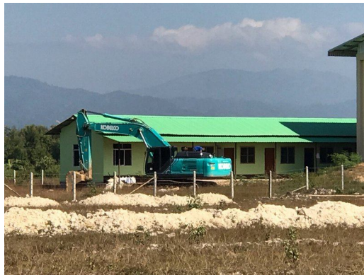
ที่ทำการของบริษัท

แหล่งข่าวในไทยรายงานว่า คาดมีแผนการขุดถ่านหินกว่า 300,000 ตันต่อปี จากพื้นที่เมืองกกซึ่งส่วนใหญ่จะส่งเข้าประเทศไทย และจะมีการสร้างโรงไฟฟ้าถ่านหินขนาด 600 เมกะวัตต์ เพื่อจ่ายไฟฟ้าเข้าโครงข่ายสายส่งของไทยด้วย เจ้าหน้าที่บริษัทไทยแจ้งว่าจะใช้เส้นทางขนส่งถ่านหิน จากเมืองกก ผ่านเมืองลุงและเมืองโฮ ไปยังบ้านตอก๊อที่ท่าซี้เหล็ก จากนั้นจะขนผ่านสะพานมิตรภาพไทย-พม่า แห่งที่ 2 เข้าสู่อำเภอแม่สาย ประเทศไทย