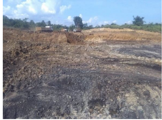
การเคลียร์พื้นที่ขนาดใหญ่เพื่อขุดถ่านหิน

ถ่านหินเท่านั้น โดยได้เริ่มขุดถ่านหิน ในวันที่ 25 ตุลาคม 2562 แต่เป็นที่ชัดเจนว่ามีการขุดเปิดเป็นพื้นที่ขนาดใหญ่และมีการกองถ่านหินไว้จำนวนมาก จึงไม่อาจเรียกได้ว่าเป็นแค่ “การทดสอบ”