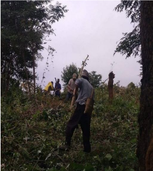
မြန်မာအစိုးရစစ်တပ်ရဲ့ လုပ်အားအတင်းအဓမ္မစေခိုင်းခံ ရသည့် ရွာသားများ

နိုဝင်ဘာ ၉ ရက်မှ စ၍ တပ်စခန်းသစ်၏မြောက်ဘက်နှင့် တောင်ဘက် လမ်း မကြီးပေါ်တွင် မြန်မာအစိုးရစစ်တပ်မှ တပ်သား က ကင်းစောင့် နေကြသည်။ ကင်းစောင့်တပ်ကို မိုင်းကျက်ရွာအဝင် ဈေးအနီးတွင် တစ်ဖွဲ့ အဆိုပါကျေးရွာမှ မီတာ 500 အကွာ တောင်ဘက်သို့ ဦးတည်နေသော လမ်းပေါ်တလျှောက်တွင် တစ်ဖွဲ့ကင်းစောင့်ချထားသည်။ ၎င်းကင်းစောင့် အဖွဲ့သည် နံနက် 6 နာရီမှ ညနေ 4 နာရီအထိ လမ်းတစ်လျှောက် ဖြတ်သန်းသွားလာသောကားများအားလုံးကို တားဆီးခဲ့ပြီး ယာဉ် မောင်းသူများကို မေးမြန်းခြင်း၊ ၎င်းတို့၏ယာဉ်များကို ရှာဖွေစစ်ဆေးခဲ့သည်မှာ ယနေ့ချိန်ထိ ဆက်လက် ပြုလုပ် နေပါသည်။