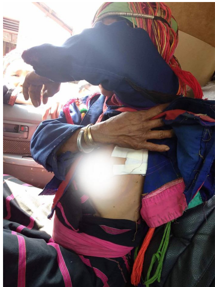
နိုင်းစံ

ဝေဟင်ကနေ လေယာဉ်ဖြင့် ဝင်ရောက်ပစ်ခတ်ခဲ့ခြင်းကြောင့် ဝမ် ပန်ခါး ရွာမှ နေထိုင်သူများနှင့် ၎င်းအနီး ရှိ မိုင်းတုံကျေးရွာအုပ်စု မှ ကျေးရွာ (၉)ရွာဖြစ်ကြသော (၁)ဝမ်ပါတက်၊ (၂)ဝမ်ကွန်နင် (၃) ဝမ်ကွန်ခါး (၄) ဝမ်မော် (၅) ကွန်တီး (၆) နိုင်းဝင်း (၇) ဝမ်ဟွန် (၈) ဝမ်ပန်ကွဲ နှင့် (၉) ဝမ်ပန်စင်းရွာမှ ရွာသူရွာသား (၇၀၀) ခန့်သည် ကျေးသီးမြို့ရှိ ကောင်အုတ်ဘုန်းကြီးကျောင်းနှင့် လွိုင်ပေါ်ဘုန်းကြီးကျောင်းတွင် သွားရောက်ခို လှုံနေကြကြောင်းသိရသည်။ မတ်လ ၁၆ ရက်နေ့တွင် ဝမ်ပန်ခါးရွာသူရွာသားများကလွဲ၍ ကျန်သောအ ခြား ရွာသားအများစုမှာ အိမ်သို့ ပြန်ရောက်နေပြီဖြစ်ကြောင်းသိရပါသည်။