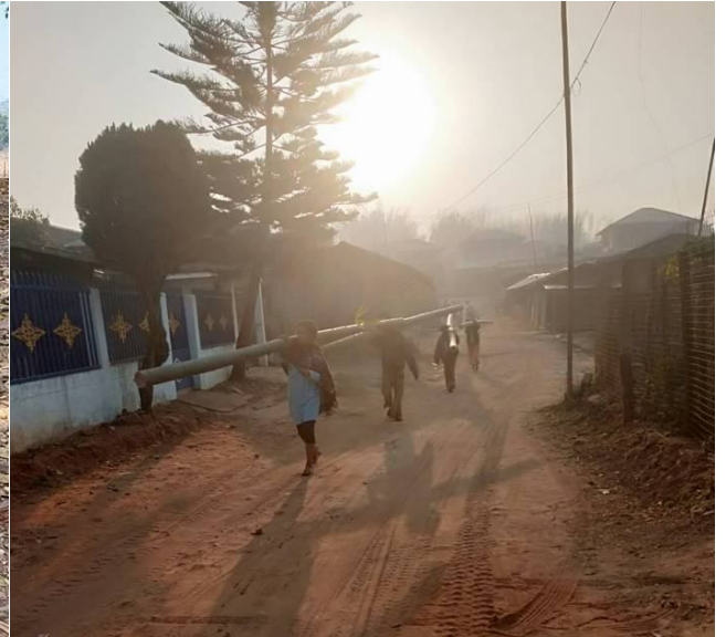
မြန်မာစစ်တပ်အတွက် ဒေသခံရွာသားများ ဝါးတိုင်ထမ်းသယ်နေပုံ

ဟိုင်းငင်း နဲ့ ကုန်းညောင် ရွာသားများကတော့ ဝါးပိုးဝါးတိုင်များကို ဝမ်လုံစံ သို့ ထရပ်ကားဖြင့်သယ်ဆောင်ပို့ပေးရပါတယ်။