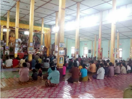
မိုင်းကိုင်မြို့နယ် ဟမ်းငိုင်းကျေးရွာအုပ်စု၊ လွိုင်စက် ဘုန်းတော်ကြီးကျောင်းတွင် ဒေသခံရွာသား များခိုလှုံ နေပုံ

ဘုန်းကြီးကျောင်းတွင် ခိုလှုံနေတဲ့ ဖါစားရွာသားတယောက် ရွာထဲပြန်လာတော့ ရှမ်းစစ်သားဘယ်မှာရှိလဲ မေးမြန်းခံရတယ်။ သူက မသိကြောင်းဖြေတော့ သူ့လည်ပင်းကို ဓားနဲ့ချိန်ပြီး “ဟို တောင်ပေါ်မှာ ရှမ်းစစ်သားတွေ မရှိဘူးလို့ မင်းတာဝန်ယူနိုင်သလား” လို့လွိုင်တွန်းကိုလက် ညှိုးထိုးပြီးမေးပါတယ်။