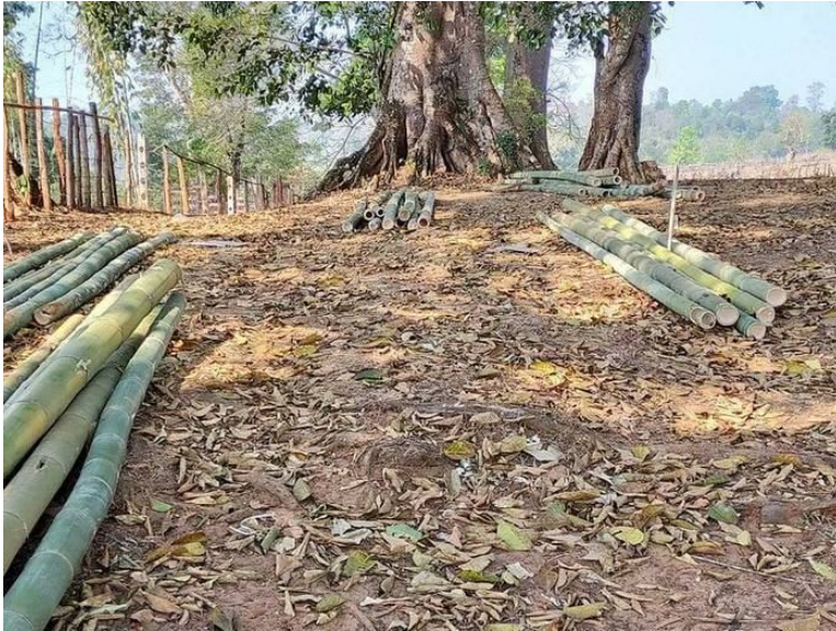
မြန်မာစစ်တပ်အတွက် ဝါးတိုင်များစုဆောင်းနေပုံ

တိုင်)၊ လွိုင်ဆိုင် (12 တိုင်)၊ ဝမ်ထမ်း (5 တိုင်)၊ လွိုင်ဆန်း (10 တိုင်)၊ ကုန်းဆန် (10 တိုင်)၊ နှင့် နော်ဆိုင် (5 တိုင်) တို့ဖြစ်ကြသည်။