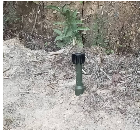
ကုန်းညောင်ဖာဆားရွာအနီး မြန်မာစစ်တပ်မှ ပစ်ခတ်လိုက်သည့် မကွဲဘဲ ကျန်ရစ်နေတဲ့ဗုံး

မတ်လ ၂ ရက်နေ့မှာတော့ ကျေးသီးမြို့နယ် မိုင်းကောင် နှင့် နောင်ဆွန်း ကြားမှာ RCSS/SSA နဲ့ အစိုးရစစ်တပ် တိုက် ပွဲဖြစ်ပွားပါတယ်။ ဝမ်ချင် ကျေးရွာအုပ်စုမှ ရွာသားများ 276 ယောက်ကျော် မိမိတို့ နေအိမ်များကိုစွန့်ခွါပြီး ဝမ်ချင် ဘုန်း ကြီးကျောင်းမှာ ခိုလှုံပါတယ်။