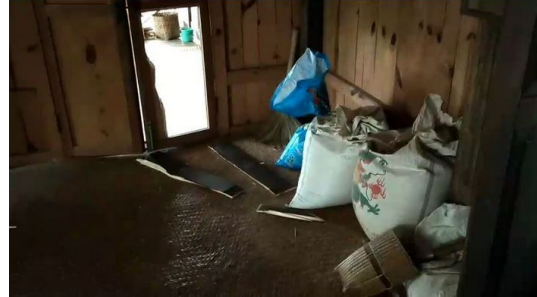
မြန်မာစစ်တပ်မှ ဖျက်ဆီးလိုက်တဲ့ရွာသားများ၏ အိမ်တံခါး

မတ်လ ၆ ရက်နေ့က ကုန်းညောင် နှင့် ဖါစား ကျေးရွာနေ ရွာသားများ က အိမ်ပြန်လာတော့ အစိုးရစစ်သားများက သူတို့အိမ်တွေကို မွေ နောက် ရှာဖွေပြီး ပစ္စည်းများ ခိုးယူသွားကြောင်း ပြောပါတယ်။