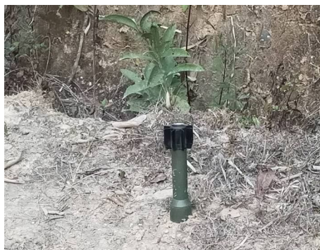
မာဂ်, သိုက်မားခင်းကခင်တူဂ်ကမ်း, တိုက်, တီးရှိုမ်း ဝါခင်းရှိုင်းလွင်း, -ဗေလး

မိုင်းဝခင်းထိ 27/2/2020 သိုက်မားခင်းပိုက်, ပင်တိုက်တီးတပွဲလွံတွမ်း။ ဂူခင်းဝါခင်းလိုင်းယူ, ရှိမ်းရှမ်းလုံးငါခင်းသိုင်ဂွင်းသိုင်မာဂ်, သေ ရှခင်ရှိုင်းမိခင်မိင်းမိ; မိခင်ခိုင်ဂင်ရှိုင်။