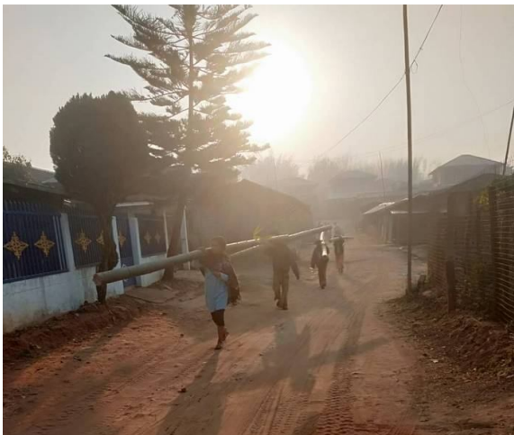
ဖွင့်၊ဂုခင်းတခင်းရှမ်း၊မိုပိုက်၊ရှမ်းပခေသိုင်းမာခင်း၊ခေ၊တပွဲ