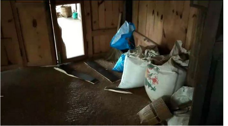
ဗေးတူရှိုခင်းဂူခင်းဝါခင်းကခင်းညးသိုင်းမာခင်းယူ၊ ခွဲသေခပ်းရှိုခင်း

ဗိုဝ်းထိုင်ဂူခင်းဝါခင်းပွက်ရှိုခင်းခိုခင်းမိုဝ်းဝင်းထိ 6/3/2020 ခခေမာဖွင်းဂူခင်းဝါခင်းဂုင်းလွင်၊ - ဗျာလးလိုင်ပံး ဖေး ခခေခိုခင်းပွက်ရှိုခင်း ယေး လံး ထုပ်းရှခင်းခွပ်းရှိုခင်း ခပ်ညး သိုင်းမာခင်းသွက် တပ်မာ၊ မိုဝ်သေမာလိုင်ဂေး၊ ညးလက်ကပ်ဂျာ။