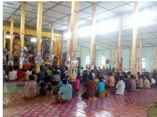
ဂူခင်းဝါခင်းကခင်းပံးဖေးပိုင်ရှမ်းတီးရွှင်းလှ လား၊ ကိုင်း၊ ရှမ်းငံး ငလးဝင်းမိုင်းကိုင်း

ဂူခင်းဝါခင်းဗျာလးဂေးခင်းလားတံးဝါး “ခင်းဝါခင်းကမ်းမီးသိုင်းတံး။ ဂူလ်းဂေးသိုင်းမာခင်းကပ်ခွင်းယိုဝ်းသွဲ၊ ရှိုခင်းဂူခင်း လွင် ဂျာလိုင်ခခေယဝ်။ သီဝ်ခွင်းဂေးကမ်းထား၊ ခပ်ယိုဝ်းမာ၊ လွင်မွက်သိုင်းလက်ခေ။ မာလိုင်ဂေးကမ်းတံး၊” ဝါး ခေ။