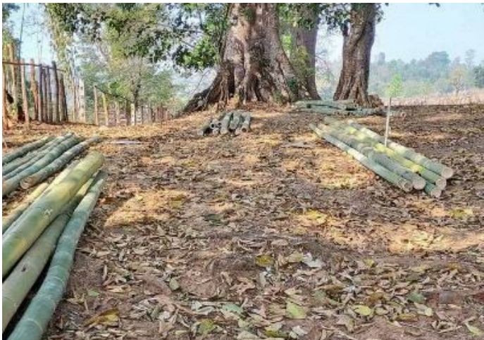
မိုပိုက်၊ကခေကပ်မာ၊ရှမ်း၊ခေ၊ခေ၊ခေ၊သိုင်းမာခင်း

ဝမ်းထိ 13/3/2020 ခေခေ သိုင်းမာခင်း၊တီး၊လွဲတွခင်း တီး၊ခေ၊ထိုင်း၊ ထုင်း၊ ရုခင်းမိုင်း 3 လမ်း ခေ၊ဂုခင်းတခင်းရှမ်းရှမ်း၊ ရှမ်းတခင်း၊တခင်းပိုင်း၊ ရှမ်းခေ၊ 7 လမ်း ရှမ်းကပ်ရှမ်း၊ပခေ၊တီး၊ခေ၊ခေ၊ခေ၊လမ်း။ လွင်၊လွဲ၊မိုင်း၊လွဲ၊ရှမ်း ရှမ်းလွဲ၊ခေ၊လံ၊ ဂမ်း လိတ် ခေ၊ယဝ်း။