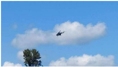
အစိုးရတပ်ရမှ ရဟတ်ယာဉ်

မနက် (၁၁)မှ (၁၂)နာရီအချိန်အထိ အစိုးရတပ်ရမှ ရဟတ် ယာဉ် တစ်စီး သည် လားရှိုးမြို့မှပျံသန်းလာပြီး ဟိုနားရွာ မြောက် ဘက်ရှိ သစ်တောအတွင်းသို့ ဗုံးများကြဲချခဲ့ကြောင်း၊ ၁၀ မိနစ် လောက် ရပ်နားပြီး နောက် ထပ်တကြိမ်ပြန်လည် ပျံ သန်းလာပြီး ဗုံး၁၀လုံးခန့် ထပ်မံကြဲချပြန်ကြောင်း သိရ သည်။