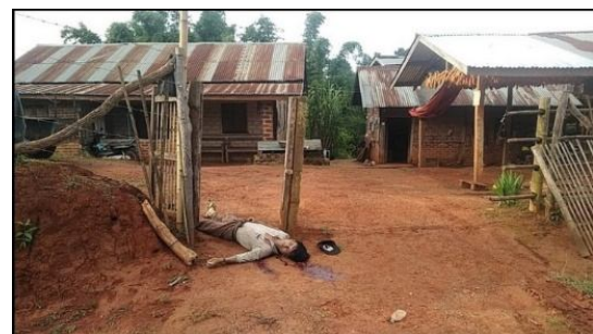
လုံးအေး ၏ ရုပ်အလောင်း

ညနေ ၆:၀၀နာရီ ကုန်းဆာရွာနေ ဒေသခံတချို့က လားရှိုးမြို့ပေါ်သို့ တိမ်းရှောင်ကြရန် မိမိတို့ ပစ္စည်းများ သိမ်းဆည်းပြီး ထော်လဂျီပေါ်သို့ တင်နေကြခိုက်တွင် ကုန်းဆာဘုန်းတော်ကြီးကျောင်း၌ တပ်စွဲထားသော အစိုးရတပ် (ခလရ-၆၈)အဖွဲ့သည် ကုန်းဆာရွာအတွင်းသို့ လက်နက်ကြီး ၆၀-မမဖြင့် အကြောင်းမဲ့ ပစ်ခတ် ခဲ့ကြောင်း၊ ပစ်ခတ်လိုက်သော လက်နက်ကြီးကျည်များသည် ရွာအတွင်းသို့ကျရောက်ပြီး ပေါက်ကွဲ သည့်အလုံးရှိသလို မပေါက်ကွဲသေးတဲ့အလုံးလည်း ရွာတွင်ဒီအတိုင်းကျန်ရှိနေသေးကြောင်း သိရသည်။