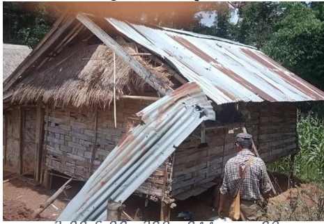
ပါဆိုင်၏အိမ်ခေါင်မိုးနှင့်နံရံများပျက်စီး

ည ရးဝဝနာရီအချိန်တွင် အစိုးရတပ်မှ ရဟတ်ယာဉ်ယာဉ်တစ်စီး သည် ဟိုနားရွာအနီးသို့ ပျံသန်းလာပြီး ရွာနှင့်မလှမ်းမကမ်းသော သစ်တောအတွင်းသို့ ဗုံးများ(၁၀)လုံးခန့် ကြဲချခဲ့သေးကြောင်း သိရသည်။