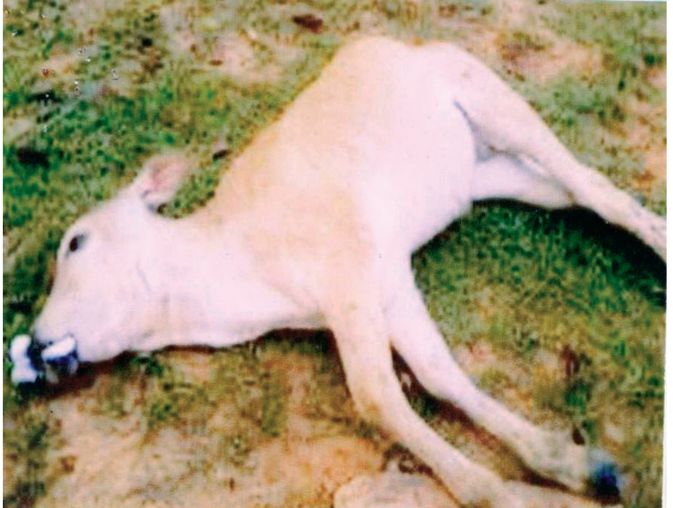
အဆိပ်မိသောနွား

ကြသည်။ ထို့ကြောင့် ရွာသားများမှာ မိမိတို့၏ကျန်ရှိနေသေးသည့် ကျွဲနွားများအား ရောင်းပစ်လိုက်ကြရသည်။ မြစ်ချောင်းတစ်လျှောက် မွေးမြူရေးငါးကန်များမှာလည်း ရေအဆိပ်သင့်ခြင်းနှင့် တိမ်ကောသွားခြင်းကြောင့် မွေးမြူ၍မရတော့ပေ။