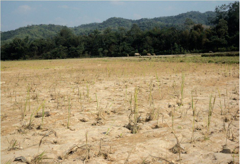
ပျက်စီးသွားသော လယ်ယာ မြေကွက်များ

လက်ရှိတွင်နားဟိုင်းလုံရွာနှင့်ဝိန်းမနော်ရွာအနီးတစ်ဝိုက်ရှိ ဒေသခံရွာသားများပိုင်ဆိုင်သော ဧကပေါင်း ၃၅၇ ခန့် လယ်ယာမြေများအားလုံးမှာ မည်သည့်သီးနှံမှစိုက်ပျိုး၍မရနိုင်တော့ပေ။ ယခင်က ယင်းလယ်ယာမြေများအတွင်း ဒေသခံရွာသားများမှ တစ်နှစ်ကိုစပါးနှစ်သီးခန့်စိုက်ပျိုးလျက်ရှိပြီး အခြားသော ဟင်းသီးဟင်းရွက်များလည်းစိုက်ပျိုးကြသည်။ ယနေ့တွင် အချို့သောရွာသားလယ်သမားများမှာ အခြားနေရာ ဒေသတစ်ဝိုက်မှ လယ်မြေများအား ငှားရမ်းကာ စိုက်ပျိုးနေကြရသော်လည်း ထိုဒေသအတွင်း စိုက်ပျိုးနိုင်သော လယ်ယာမြေနေရာမှာ နည်းပါးသဖြင့် ဤသို့ လယ်ယာမြေများအားလုယက်ငှားရမ်းစိုက်ပျိုးခြင်း စသည့်ပြဿနာများဖြင့်လည်း ကြုံတွေ့နေကြရသည်။