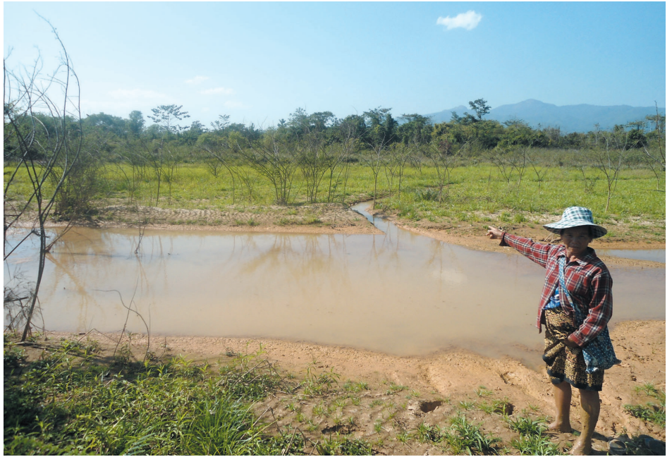
ပျက်စီးဆုံးရှုံးသွားသည့် ဒေသခံအမျိုးသမီးတဦး၏ လယ်ကွက်

ယင်းကုမ္ပဏီများမှ ဒေသခံပြည်သူများအား ပေးသောအခြားလျော်ကြေးဆိုင်ရာအထောက်အပံ့များ အကူအညီများမှာ တောင်ကုန်းရေအရင်းမြစ်ရှိရာနေရာမှ နားဟိုင်းလုံရွာအထိ ရေပိုက်များ အချို့သွယ်တန်း ပေးထားခြင်းနှင့် ရေလှောင်ကန်ကြီးတစ်ခုချထားပေးသည်။ ယခင်က ဒေသခံများမှာ ချောင်းရေကိုအမှီပြု လျက် ရေအားမီးစက်အသေးစားများအသုံးပြုကာ လျှပ်စစ်မီးများသုံးစွဲလာရာ ရေတိမ်လာခြင်းကြောင့် ရေအားမီးစက်များ အသုံးမပြုနိုင်တော့သဖြင့် ယင်းကုမ္ပဏီများမှ ဒေသခံများအား ဆိုလာပြား ၂၄ ချပ်နှင့် ဘက်ထရီများကိုအစားထိုးပေးခဲ့သည်။ သို့ရာတွင်လည်း ယင်းဘက်ထရီများမှာတစ်နှစ်သာခံသဖြင့် တစ်နှစ် တစ်ကြိမ်အသစ်ပြန်ဝယ်လဲကြရပြီး ကုမ္ပဏီမှပေးသော ဘဏ္ဍရီအခြောက်အမျိုးအစားသည် ပေါက်ကွဲတတ် သည်။