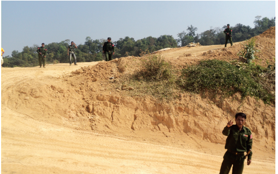
ရွှေတူးဖော်ရေးစီမံကိန်းလုံခြုံရေးချထားသည်။ မြန်မာနယ်ခြားစောင့်တပ်

၂၀၀၇ ခုနှစ်တွင် စိုင်းလောင်ဟိန်းကုမ္ပဏီ၊ မင်းဦးအောင်ကုမ္ပဏီ၊ ဟိန်းလင်းစံကုမ္ပဏီ၊ စံပါရ မီကုမ္ပဏီနှင့် ဝဏ္ဏသိန်းသန်းကုမ္ပဏီများမှ ယင်းဒေသအတွင်းရွှေများအား စတင်တူးဖော်ခဲ့ကြသည်။ နောက် ပိုင်းတွင် စိုင်းတစ်ကုမ္ပဏီ၊ လွယ်ခမ်းလုံကုမ္ပဏီ၊ စိုင်းစိုက်ပျိုးရေးရင်းနှီးမြုပ်နှံမှုကုမ္ပဏီ၊ ရွှေတောင်ကုမ္ပဏီနှင့်