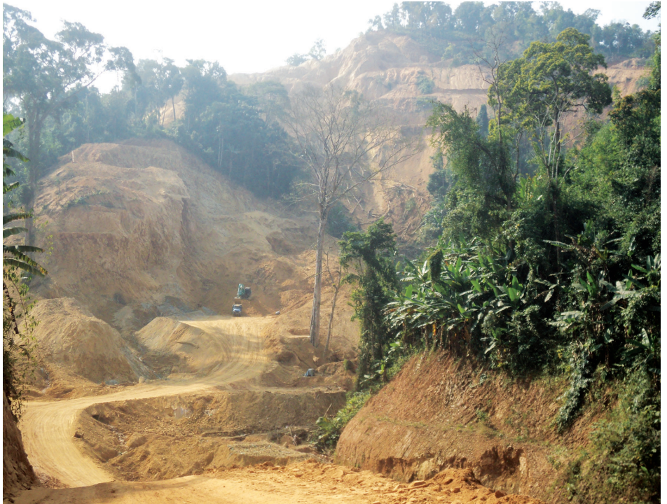
ရွှေတူးဖော်ခြင်းကြောင့် လွယ်ခမ်းတောင်ကုန်းပျက်စီးနေပုံ

၂၀၀၇ ခုနှစ်မှစ၍ ရှမ်းပြည်နယ်အရှေ့ပိုင်း၊ တာချီလိတ်ခရိုင်၊ တာချီလိတ်မြို့နယ်၊ တာလေမြို့နယ်ခွဲနှင့် မဲခေါင်မြစ်ကြားရှိသည့် လွယ်ခမ်းတောင်ကုန်းများပေါ်တွင် ကုမ္ပဏီပေါင်း ၁၀ ကျော်တို့မှ ရွှေတူးဖော်လျက်ရှိသည်။ လက်ရှိတွင် တောင်ကုန်းနားတစ်ဝိုက် ၁၁ မိုင်ပတ်လည်ခန့်ရှိ သစ်တောကို လည်းတူးထုတ်ခဲ့ပြီးဖြစ်ပြီး၊ ယင်းကဲ့သို့ ရွှေတူးဖော်ရာမြေတိုက်စားခြင်းနှင့် ရေထုညစ်ညမ်းခြင်းဖြစ်စေသဖြင့် တူးဖော်ရေးစီမံကိန်းအနီးအနားရှိရွာနှစ်ရွာမှ ဒေသခံလူဦးရေပေါင်း ၃၄၀ ကျော်ခန့်မှီခိုလှုပ်ကိုင်စားသောက်လျက်ရှိသော လယ်ယာမြေစိုက်ပျိုးရေးအသက်မွေးဝမ်းကြောင်းမှာလည်း ပျက်စီးဆုံးရှုံးမှုနှင့် ကြုံတွေ့နေရသည်။ စီမံကိန်းတစ်ဝိုက်ရှိ နမ့်ခမ်းချောင်းကို တိုက်ရိုက်အသုံးပြုနေသော ရွာများနှင့်နမ့်လင်းချောင်းကိုမှီခိုအားထားနေရသော အခြားရွာများမှလူဦးရေ ၅၅၀၀ ခန့်သည် ရွှေတူးဖော်ရေးနေရာအားတိုးချဲ့လာခြင်းကြောင့် စိုးရိမ်ပူပန်မှုများ၊ အခက်အခဲများဖြင့် ကြုံတွေ့နေရသည်။ ယင်းသက်ရောက်မှုကိုခံရသည့် ဒေသခံရွာသူရွာသားများမှ ဤရွှေတူးဖော်ရေးစီမံကိန်းများအား ခြွင်းချက်မရှိလုံးဝရပ်ဆိုင်းရန်၊ ပျက်စီးသွားသည့်မြေများ၊