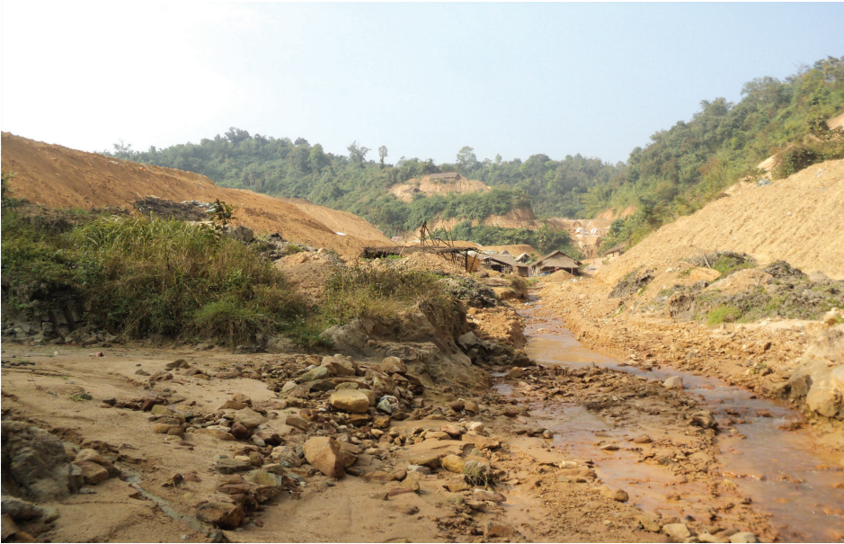
နမ်. ခမ်းချောင်းတိမ်ကောလာခြင်း

လက်ရှိတွင် ချောင်းအနက်မှာတိမ်လာရာ မိုးရွာသည့်အခါ ချောင်းဦးအထက်တောင်ကုန်းများမှ စီးဆင်းလာသောရေများမှာ မြစ်ချောင်းအတိုင်းယခင်ကလိုမစီးဆင်းနိုင်တော့ဘဲ အနီးရှိလယ်ယာစိုက်ပျိုးမြေများ၊ ရွာများအတွင်းစီးဝင်လေ့ရှိသည်။ ထို့သို့စီးဝင်လာသောရေများနှင့်တကွ အဆိပ်အတောက်များ၊ တူးဖော်ရေးမှစွန့်ပစ်အညစ်အကြေးများ၊ သစ်တောများဖျက်ဆီးခြင်းကြောင့် သစ်မြစ်သစ်တုံးများလည်း သဲမြေများနှင့်အတူ လယ်ကွင်းထဲသို့သယ်ဆောင်လာကြသည်။