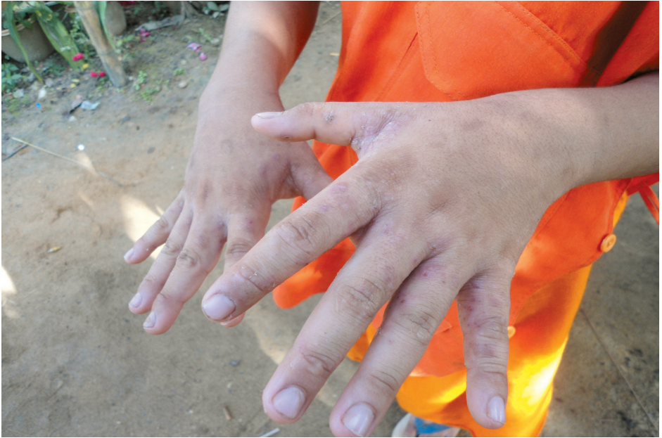
အရေပြားယားယံခြင်း