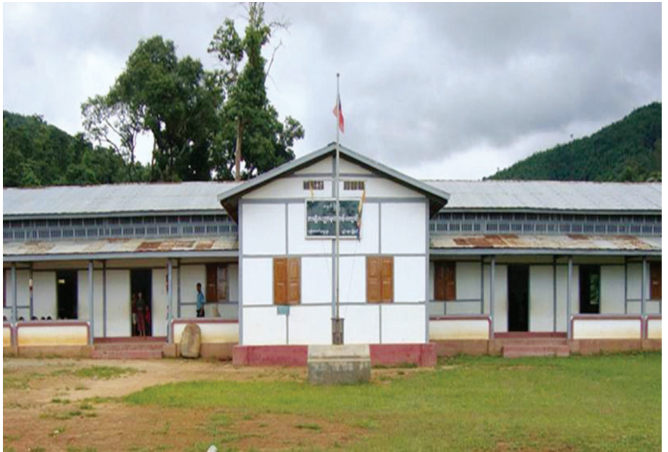
အစိုးရစာသင်ကျောင်း

၂၀၀၈ ခုနှစ်မတိုင်မီ နားဟိုင်းလုံရွာအတွင်းရှိ လူငယ်များမှာ စိုက်ပျိုးရေးကောင်းမွန်သဖြင့် ဝင်ငွေကောင်းရာ နိုင်ငံခြားသို့ဝင်ရောက်လုပ်ကိုင်ကြခြင်းများမရှိပေ။ သို့သော်ယခုတွင် မိမိတို့ရွာအတွင်း လုပ်ကိုင်စားသောက်၍ မရတော့ခြင်းကြောင့် နားဟိုင်းလုံရွာအတွင်းလူငယ် ၃ ပုံ ၂ ပုံခန့်တို့မှာ အိမ်နီးချင်းနိုင်ငံ များဖြစ်သည့် ထိုင်းနိုင်ငံနှင့် လာအိုနိုင်ငံများအတွင်းသို့ သွားရောက်အလုပ်လုပ်ကိုင်လာကြရသည်။ လာအိုနိုင်ငံ အတွင်း ယင်းလူငယ်များသည် မဲခေါင်မြစ်တစ်လျှောက် ကာစီနိုလောင်းကစားရုံများအတွင်း ဝင်ရောက် လုပ်ကိုင်လျက်ရှိသည်။