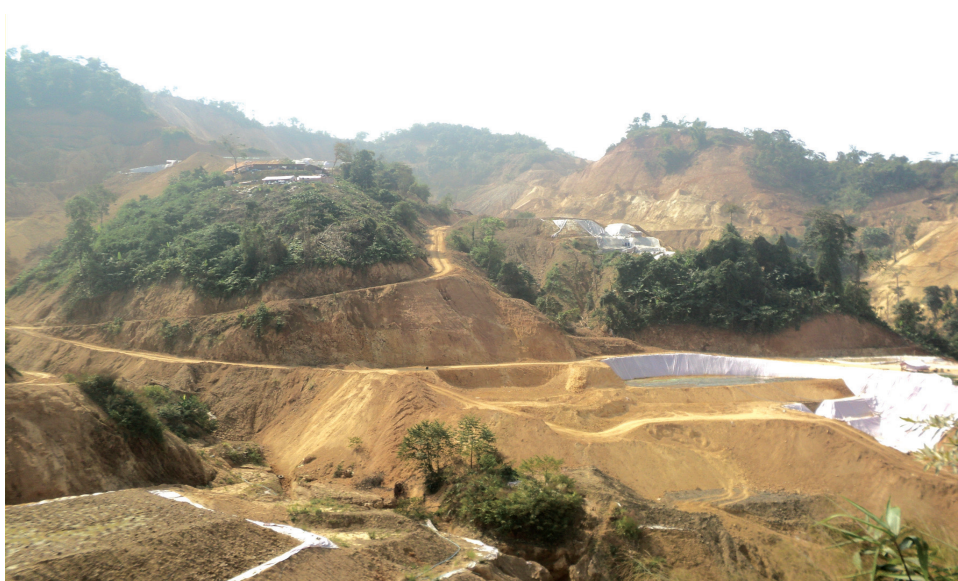
လွီခမ်းကခင်းထုဂ်၊ လှိုင်ယုယွခင်းခုတ်းခမ်း

တင်းစတား၊ ပီ ၂၀၀၇ တော့ယမ်းလီဝ် ခွမ်းပခဏီ ၁၀ ပါထာဂ်၊ ဂူခင်း၊ လှိုင်ခုတ်းသေး ကပ်ခမ်း သခင်လွီ “ လွီခမ်း ” ဟိုခင်း၊ ခိုင်ဝါခင်းခင်းရှိုးလှိုင် ကိုင်၊ မိုင်းလီခင်း ကခင်းမီးခင်း စကးဂိုင်၊ စကးဝိုင်းတားလှိုင်၊ စလး စမးခမ်း ခွင်ခင်းစကးဝိုင်းတားခီးလီဂ်းလှိုင်တီးပွတ်းကွက်၊။ မိုင်းလီဝ် ထိုခင်း၊ လှိုင်တင်းဂွင်းမွက် ၁၁ လက်းပခင်း၊ ရှပ်ခင်း၊ လီးထုဂ်၊ ခွမ်းပခဏီခုတ်းခမ်း ခုတ်းဂူခင်း၊ တေးလွီ ယုလီဝ်ထိုခင်း၊ ခိုင်း ဂေးခမ်း နှိတ်းရှိုးလှိုင်၊ ရှိုးလှိုင်ခင်း ရှပ်ဂူခင်း မွက် ၁၄၀ ခင်းတူင်၊ တင်၊ ခခင်း ရှပ်တင်းယပ်၊ ဟိုတ်၊။ ဂူခင်းမိုင်းမွက် ၁,၅၀၀ ခင်း ၈ မူ၊ ဝါခင်းစလး လှိုင်ပိုင်းကိုင်လှိုင်တိုင်းစမးခမ်းခမ်းစလး ဂေးခမ်းလီခင်းဂေးတုမ်ယွခင်း ပုး။ ထုင်သါခင်းရှင်းခမ်း၊ သပ်၊ ဂေးခမ်းလီခင်းခင်း တီးလီခင်းမီးဟုခင်းငှး မာဂ်၊ ပုင်းရှင်း ခွခင်း။ ယမ်းလီဝ် မာဂ်၊ ဂေးကမ်း၊ ပုင်းရှင်းဂေးကမ်းခွခင်း သမ်းလီးဂူခင်းခွမ်းစမးခွက်၊ မိုင်းခင်းမိုင်းခမ်းထီင်း။ ဂူခင်းဝါခင်းကွခင်းဂခင်းတုဂ်းယွခင်း ရှိုးဂိုတ်းယိုတ်း ဂါခင်းခုတ်းစကးခုတ်း ခမ်းဂမ်းလီဝ်။ တီးလီခင်းလှိုင်လှိုင်၊ ဂေး ထုဂ်၊ လီးစမးပခင်းခိုခင်း၊ ပုးလီဝ် ခမ်းရှင်းခမ်း ဂေး ရှိုးပေးလှိုင်ခင်းလီခင်းသို ရှိုးမိုခင်းခိုခင်း ပဂ်းဂပ်၊ ပိုင်ဂပ်။ သုခင်းခင်း ခခင်းပု။ ဂေးခမ်း၊ ပု၊ မိ။ သတ်းလီဝ်လှိုင်လှိုင်လှိုင်တီးရှိုးဂူ၊ ယွခင်းမိုင်းခမ်း တင်းသီင်းခခင်း ရှိုးသီးတီးခင်းပခင်း ဂေးခင်းတင်းမူတ်း။