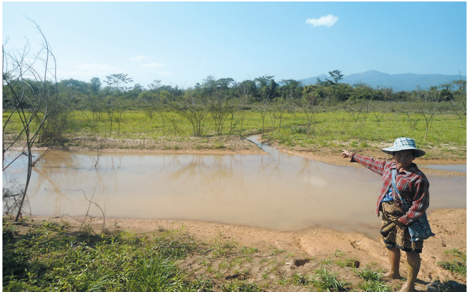
ခမ်းပုဂျေ၊ ခိုင်း၊ ထီးခေဇုခင်းမခင်းကခင်းလီးထုဂ်၊ ဒီးလိခင်းခုတ်းခမ်းထုမ်ဂွံ ကမ်၊ လင်းရှိတ်းတေ၊

တင်းစတ၊ ပီ ၂၀၁၂ မှာ ဂူခင်းဝါခင်းခင်းဝါခင်းရှီးလူင်စလး၊ ဝီင်းမခေဇု၊ ခပ် တီမ်း လိဂ်းတင်၊ ထိုင်လင်းခေဇုတီးထိုင်ဂီဝ်၊ ခွင်းခပ်သေ တုဂ်းယွခင်းရှီးဂိုတ်းယိုတ်းလွင်းခုတ်း ခမ်းစလး၊ ပိုဝ်းတု၊ ရှီးခွမ်းပခေဇုခပ်ပေဇုတေကာဝ်းပခင်းခိုခင်း တီးလိခင်းရှီးယူ၊ ခင်းငင်းလီး ဗှင်ရှင်၊ မိုခင်းဂပ်၊ သေ ခိုခင်းသီးတီခင်းပခင်းဂိုင်း၊ ငမ်း။ မိုဝ်းကွခင်းတင်း ဂူခင်းဝါခင်းခပ် ရှိတ်းခေဇုသေ ယမ်းမီးလီးလီး၊ ဝါးခါခင်း၊ ၁ ကေးဂျေလွ် ၅၀,၀၀၀ ဝါတ်၊ ဝိုခင်းထီးယူ။