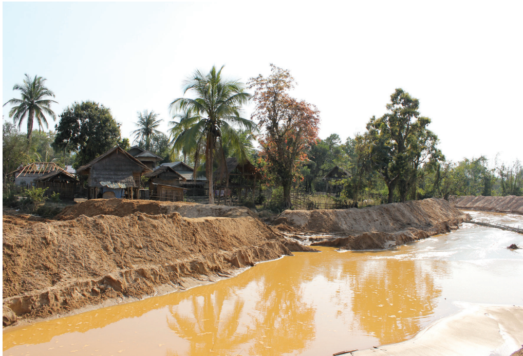
ခမ်းပိုင်းကားဒုင်းခမ်းကမ်းကပ်လေး