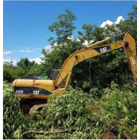
รถไถของบริษัทกำลังไถที่ดิน

คนงานกลุ่มเดียวกันกลับมาไถพื้นที่อีกครั้ง (และยังคงไถพื้นที่นี้ทุกวันหลังจากนั้น)