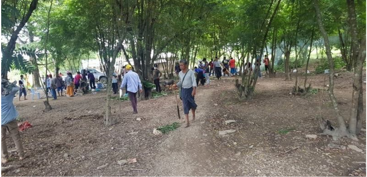
คนทำงานให้ทหารว่าขณะกำลังกินข้าวในที่ดินของชาวบ้าน

เกษตรกร 45 คน ส่งจดหมายไปยังหลายหน่วยงานในท่าซี้เหล็ก (รวมทั้งหน่วยงานระดับตำบลและหน่วยงานระดับอำเภอ สำนักงานข้อมูลที่ดิน และสถานีตำรวจในพื้นที่) เพื่อร้องเรียนเกี่ยวกับกรณีบริษัทหิงบังรุกกล้าเข้ามาในที่ดินของตน และขอให้หน่วยงานเหล่านั้นดำเนินการแก้ไข แต่ยังไม่ได้รับคำตอบใดๆ