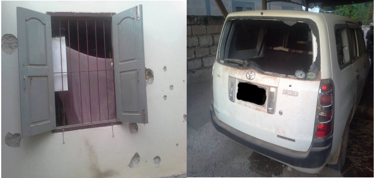
လက်နက်ကြီးပုံးကျည်ကျသဖြင့်ပျက်စီးသွားသော(နန်းကိန်)၏အိမ် လက်နက်ကြီးပေါက်ကွဲမှုကြောင့်ပျက်စီးသွားသောကား

အောက်တိုဘာလ ၂၈ ရက် ၂၀၁၅ ခုနှစ် ဗုဒ္ဓဘာသာဝင်တို့၏ သီတင်းကျွတ်ရက်ဖြစ်ရာ ဝမ်ဟိုင်း ကျေးရွာမှရွာ သူရွာသား ရာကျော်တို့မှာ ညသန်းခေါင်ယံအချိန်တွင် ဘုန်းကြီးကျောင်းတွင် ရိုးရာထုံးတမ်းစဉ်လာအတိုင်းဝါ ကျွတ်ပွဲကျင်းပရာ ဗမာစစ်သားဘက်မှစ၍ ၁၂၀ မမ ဖြစ်ပစ်ခတ်ခဲ့သည်။ ထိုပွဲကျည်သည် ဝမ်ဟိုင်း ရွာထဲတွင် အမြောက်ကျည်ဆန် (၈) လုံးကျခဲ့ပြီး ၂ အိမ်ပျက်စီးခဲ့ပြီး အသက် (၄၀) နှစ်ရှိ အမျိုးသမီးကြီး (၁) ဦးနှင့် သူမ၏ သမီး အသက်(၅) နှစ်တို့အိပ်နေချိန်တွင်ပုံးကျထိမှန်ဒဏ်ရာရခဲ့သည်။