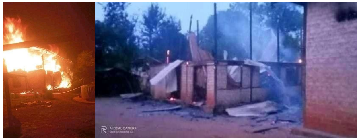
လွှစင်ကျေးရွာရှိနေအိမ်များကို စစ်ကောင်စီတပ်ဖွဲ့ဝင်များက မီးရှို့ဖျက်ဆီးပုံ