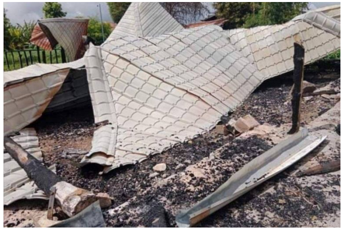
ခိုက်းရှိုခင်းဂူခင်းဝါခင်း;ကခင်းသိုက်းမာခင်း;သွက်;တပ် ခင်းဝါခင်း;လွံပဝ်း ရှိုခင်းဂူခင်းဝါခင်း;ကခင်းသိုက်းမာခင်း;ကပ်ဖွံးလုတ်,ခင်းဝါခင်း;သွင်ခခမ်.ကေး

ဝခင်းထိ 26/5/2022 သိုက်းမာခင်း;ကခင်းပဂ်းခိုင်လွံမိုင်းဂူ; ဗံး,ကွဂ်,ကိုင်,လွံပဝ်းခခင်း. လူင်းလွံ မျးခင်း ဝါခင်း;မာဂ်,ခိုင်ခမ်းသေ တ,ကပ်ဖွံးလုတ်,ရှိုခင်းဂူခင်းဝါခင်း; ဖွင်းခါဝ်းယါမ်း 7 မူင်းတါမ်းခမ်း။ ရှိုခင်း ဂူခင်းဝါခင်း; 20 ပံးလျးဖွံးမံး။