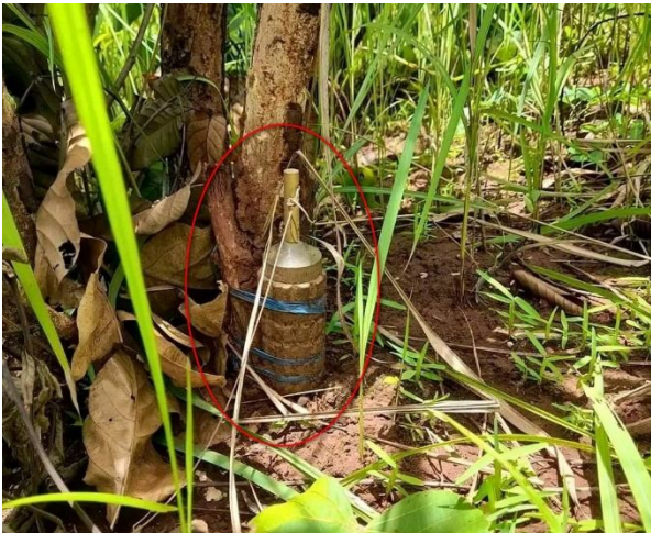
မာဂ်,ဗှင်လိခင်းကခင်းသိုက်းမာခင်း; ရှိုင်းပံး.လွမ်းတိခင်းလွံမိုင်းဂူ;

ဝခင်းထိ 21/6/2022 သိုက်းမာခင်း;ကခင်းပဂ်းယူ,ခင်းဝါခင်း;ခခမ်.မေ့,လူင် ယျးတပ်ကပ်ခိုက်းရှိုခင်း; ရှုတ်းခိုင်; ခိုင်;လမ်း၊ လိခင်းပုလ် (မေ,ကေးလျး) ဂလး;လါဂ်;ထံခေးဂူခင်းဝါခင်း;ယဝ်. ကပ်ဖွံး လုတ်,ရှိုခင်းဂူခင်း ဝါခင်း;သမ်လင်။