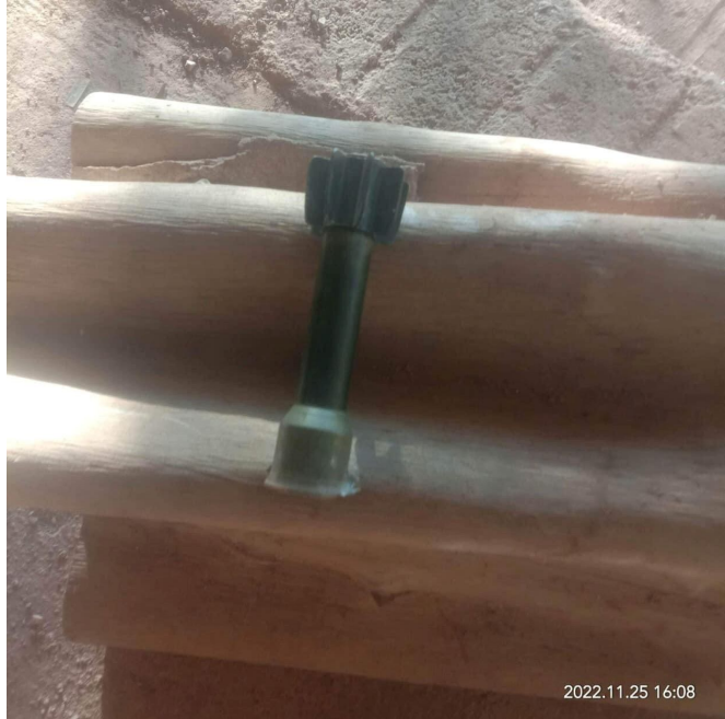
မာ်,လှိုင်သိုက်မာခင်းကခင်းတိုက်ခင်းဝါခင်းဂုင်းသျှ,

ယွခင်း.တိုက်လှိုင်ဂှ မာ်,လှိုင်သေ ဂူခင်းဝါခင်းဂုင်း သျှ,လေး, ဝါခင်းဂှိုမ်းဂှိုမ်းမွက်; 700 လံးကွခင်း ဂခင်းပံး ဗေးသိုက်။ ဂမ်းဗွင်းပံးသေျှ.ဂှိုမ်းလွမ်း ဝတ်.ခင်း ဝါခင်း၊ ဂျှင်းတြေးလရီယခင်း, ဂမ်းဗွင်းပံး သေျှ.ဂှိုမ်း တီးဝတ်. ခင်းဝိုင်းသီ,ပေျှ.။