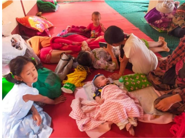
ဂူခင်းပံး၊ ဘေးလှိုင်းပိုင်းရှိုင်းပံး၊ လှိုင်းခင်းလှိုင်းဝတ်း/ရွှင်း

ဝံးပာင်တိုက်းယဝ်. တပ်.သိုက်းလိုင်;တံး SSPP/SSA ထွံကွက်,ဝါခင်းဂုင်းသျှ၊ ဂူလှ်း ဂျးသိုက်းမာခင်း သိုပ်,ယူ, ဝံ. လှိုင်းရှိုင်းရှိုင်းဝါခင်း။ ထိုင်ဝခင်းထိ 30/11/2022 မျး ဂူခင်းဝါခင်းဂမ်းခမ်ကွခင်းဂခင်းပွက်;ရှိုင်းခိုခင်း။ ဂမ်း ဗွင်းဂျေးရှခင်းခွင်းခွင်ရှိုင်းခမ် လျးသိုက်းမာခင်းသွက်;တပ်။