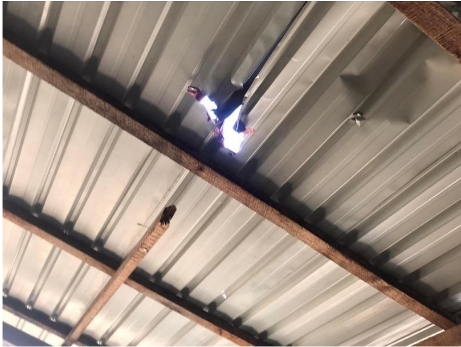
လီဂ်းမုင်းလင်ရှိုခင်းကုခင်းဝါခင်းရင်းသျှ, ကခင်ဂျူးလၢဂ်,မၢဂ်,လူင်သိုဂ်းမၢခင်း