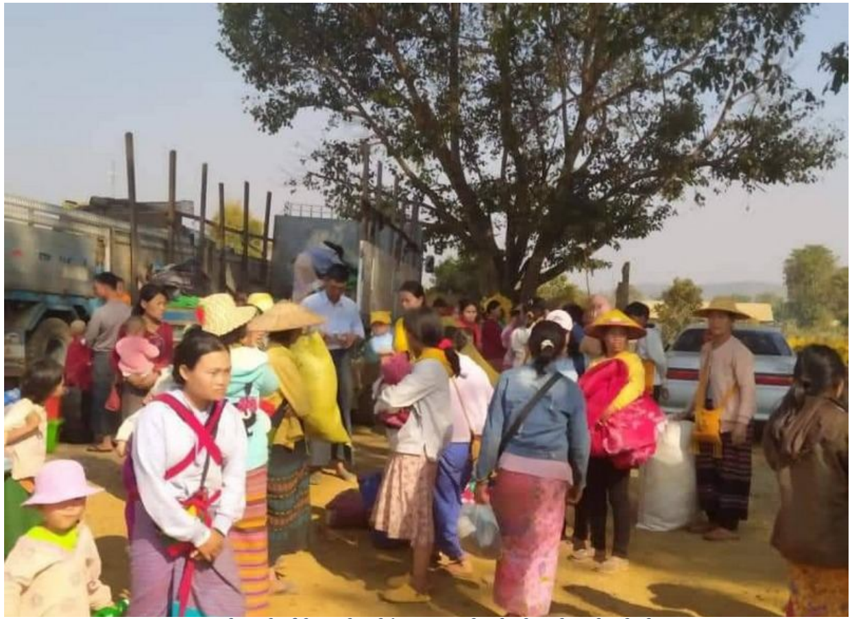
ရှိုခင်းဝါခင်းလှိုင်ခါခါခိ.မီးလင်ရှိုခင်းမွတ်.ရှိုခင်းယူ,သင်း 200 ပံာ ပီခင်း ဝါခင်း; ပီးခင်း.ထခု ယူ, လွမ်းဂခင်းယူ,ယဝ်.။

ဝါခင်းလှိုင်ခါခါခိ.မီးလင်ရှိုခင်းမွတ်; 80 သေမီးရှိုခင်းယူ,သင်း 200 ပံာ ပီခင်း ဝါခင်း; ပီးခင်း.တံး ငလ; ပီးခင်း.ထခု ယူ, လွမ်းဂခင်းယူ,ယဝ်.။