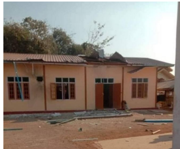
ဝတ်.ဝုး ကခင်းလုးမာဂ်,ခိုင်းမိခင်းသိုင်းမာခင်းပွဲ,လုင်း တိတ်,သို,

မိုင်းဝမ်းထိ 10/2/2023 ယမ်းဂင်ခင်းခခခ. သိုင်းမာခင်းမမယ 502 လေးမမယ 505 ကခင်းယူ,ပုး တံးဝင်း ငုခင်းဂုမ်းဂမ်ဗီခင်းဂါခင်းယခင်း,သိုင်း (လဂခ၁) ပံတင်းရွတ်းဗီခင်းရှိုင်းဝါခင်းလုင်ခါခင် တင်းလါခင်း။ မိုင်းခပ်ရွတ်းဗီခင်းဂျ,ခေးတင်းကွဂ်,ဝါခင်းခခခ. လုံးမီးပင်တိုင်းရှိုတ်,ခိုခင်းလွမ်းလုမ်း PDF ကခင်း တူင်.ခိုင်းယူ,လွမ်းခင်းပိုခင်း.တီးခခခ.။