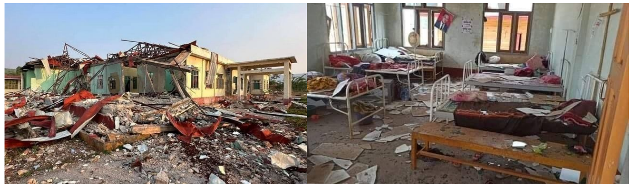
စစ်ကောင်စီ၏လေကြောင်းတိုက်ခိုက်မှုကြောင့် ထိခိုက်ပျက်စီးခဲ့ရသော ဆောင်ဖွေးကျေးရွာဆေးခန်း

ဧပြီလ ၂၅ ရက်နေ့တွင် စစ်ကောင်စီတပ်သည် မည်သည့်တိုက်ပွဲမှဖြစ်ပွားခြင်းမရှိသော ဖယ်ခုံမြို့နယ်ဆောင်ဖွေးကျေးရွာ တွင် စစ်ဘေးရှောင်ပြည်သူများခိုလှုံနေသော ဆောင်ဖွေးဆေးပေးခန်းကို လေကြောင်းမှတစ်ဆင့် ပစ်ခတ်တိုက်ခိုက်ခဲ့ရာ အဆိုပါဆေးခန်းတွင် မီးဖွားရန်ရောက်ရှိနေသောကိုယ်ဝန်ဆောင် အမျိုးသမီးတစ်ဦး သေဆုံးကာ သူနာပြုတစ်ဦးအပါအဝင် ၃ဦးဒဏ်ရာရရှိခဲ့သည်။