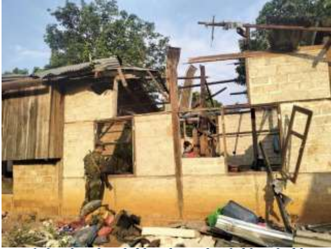
ရှိုခင်းဂူခင်းဝါခင်း;သမ်သိုဝ်ကခင်းဂုးမာဂ်,လူင်သိုဂ်းမာခင်းယိုဝ်း

မိုဝ်းဝခင်းထိ 15/5/2024 ခာဂ်းယာမ်းမွဂ်; 10 မူင်း ဂာင် ခမ်း; ကမ်,မီးပာင်တိုဂ်းသင်သေ သိုဂ်းမာခင်း; ကခင်း ပဂ်းယူ,တီးဂိုမ်းဝါခင်း;ပာင်ပွံး (ပာခင်း.ပူလ်း) ခခင်း. ကပ် မာဂ်,လူင်ခပ်ယိုဝ်းခပ်;ဂျ,ခင်းဝါခင်း; သမ်သိုဝ် သမ်ဂမ်း။ မာဂ်,လူင်တူဂ်းခင်းဝါခင်း; သေ ဂိုတ်းရှိုခင်းဂူခင်း ဝါခင်း; 7 ဂေ့.မာတ်,လိပ်းလေး; ရှိုခင်းဂူခင်းဝါခင်း;မွဂ်; 10 လင်လု ခွံပုး။