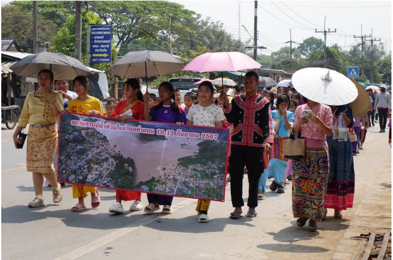
ภูอင်းผိုင်းອင်းပိုခ်.တီ; လိပ်ပံးပံး.ကအ်အေမ်.ဂူဂ်းအွင်းထုမ်းအွင်းတးတွအ်း အွင်းလူခ် သိမ်းသိမ်းပိုင်း 2024