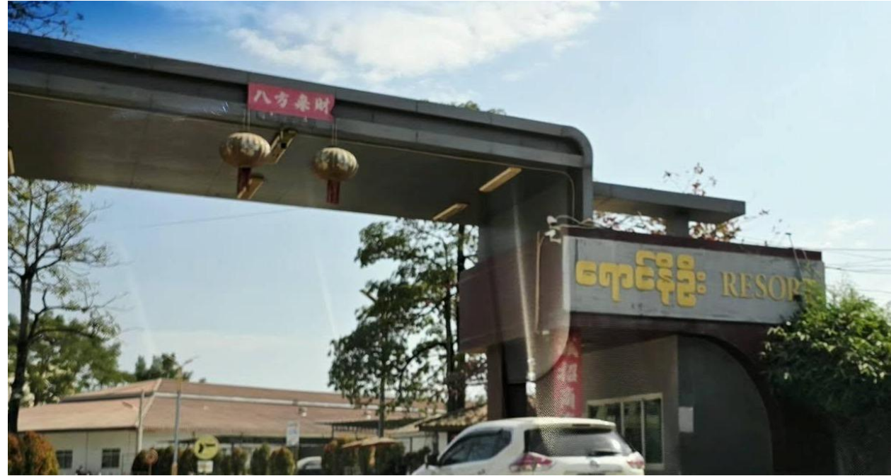
တင်းခပ်;ဝင်းယွင်,ခီ,ကူး (ခိပ်းရှင်; ဗူ;တွံ,ရှိုတ်း)

မိုင်းရှင်ပိ 2024 ဗူ;ဗဟ်;ဂါခင်ချးလင်းမခင်းဂေး.ခိုင်; ကခင်ရှမ်းယမ်းရှိုတ်းဂါခင်လွမ်းဂခင်မး တီးခွမ်း ပခင်း ကွခင်တင်းခခင်. ခိုခင်းမးရှင်.ချးဂျ,ရှိုတ်းဂါခင်လွမ်း မခင်းလတ်းဝု; ခပ်တေခတ်, ဂါခင်ခိုခင်း ယပ်.ခံ။ ခခင်.ပိခင်လွင်းချး ကမ်,ရှိုတ်းဂါခင်ပခင်ခွမ်းပခင်းတီးခင်းဝင်းယွင်,ခီ,ကူးယပ်. သေ ခတ်, ပိခင်တီးပခင်ရှုချးမိုင်းလိပ် ရှိုတ်,ခိုခင်းခခင်.ယပ်.။ ဗွင်းခခင်. ပိဂ်.သမ်.လွင်းဗီဝ်;လင်.ခံ. ရှမ်းရှိုင်း သေတု. ရှမ်းတိုက်.လံးရှိုတ်းဂါခင်လပ်.လပ်. ယူ,ခင်းဝင်းခခင်.။