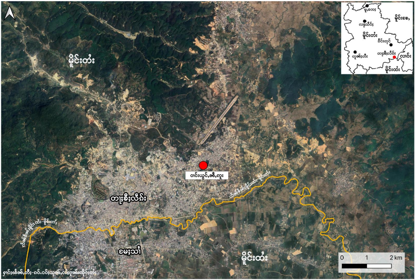
ကွင်းတီးတၢင်းယွင်,ခေ,ကူးခွင်သိုဂ်းဝ UWSA ကခေမိးခေခေတၢ်းဒီးလိာ်း