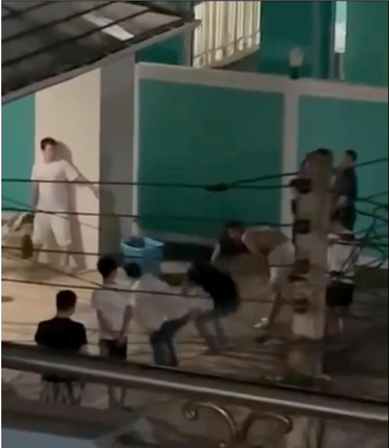
နိပ်းရှပ်းဂါခင်ကာ်မးခင်းလင်းရှပ်းတူင်. (video) ကခင်ဂူခင်းရှ်းဂါခင်ကွခင်းလံးခပ်လျးတာမ်, လုဂ်.ခခင်း ခင်းဝါင်းဂါခင်ယွဂ်,လီခင်တာင်းကွခင်းလံး

မေးမခင်းတေရှုငိုခင်းပခင်။ ဗုဒ္ဓလတ်းဂါခင်ခခင်. လာတ်းခခေရင်းခပ်လိုင်.ခခခင်သေ ထိုင်မးယမ်းဝံး ဝခင်း မီးဂး ရှံးလာ်း (a Hilux station wagon) လမ်းခိုင်မးရှပ်.ရှပ်းခးဂျှ။ တာင်းခေးမီးလင်းဂးလး ဂူခင်းလံး ထိုင်ဂျေ.ခိုင်ခင်းသေ တာင်းလင်သမ်. မီးရှပ်းခးသမ်ဂျေ.လး; ဂူခင်းရှ်းဂါခင်လာ်း ခခ,တီးခွမ်းပခင်းရှပ်.ပုခင်းဗုဒ္ဓခင်းတေလံးမးလွမ်းရှပ်းခး။